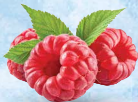
Maline Garden Good 400 g • T.P.: 20 kos • ŠIFRA art.: 107531 • Cena: 3,4163 • Cena z DDV: 3,74