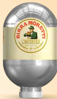
Pivo Birra Moretti Blade 8 l T.P.: 1 kos ŠIFRA art.: 678557