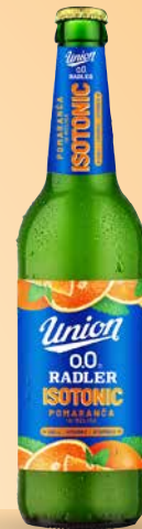
Radler Isotonic pomaranča, pločevinka, 0,5l T.P.: 20 ŠIFRA art.: 122471