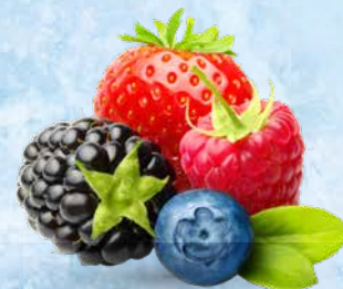
Mešanica gozdnih sadežev 2,5 kg T.P.: 4 kos • ŠIFRA art.: 373669 Cena: 9,7500 • Cena z DDV: 10,68 Cena za kg: 3,9000