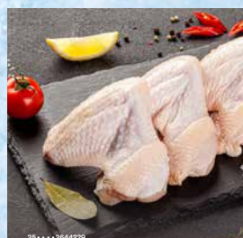
Piščančja krila 2 delna, Gastro, pakirana, cena za kg T.P.: 1 kg ŠIFRA art.: 632965