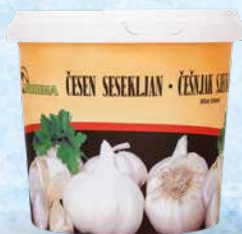
Česen sesekljan v vodi, pripravljen za takojšnjo uporabo pri kuhanju najrazličnejših omak, juh, mesnih in ribjih jedi, 1 kg • T.P.: 6 Kos • ŠIFRA art.: 061030 • Cena: 3,9000 • Cena z DDV: 4,27