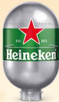
Pivo Heineken Blade , 8 l sod T.P.: 1 kos ŠIFRA art.: 548810