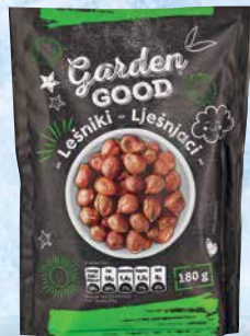
Lešniki Garden Good jedrca, 180 g • T.P.: 12 kos • ŠIFRA art.: 875755 • Cena: 3,4632 • Cena z DDV: 3,79