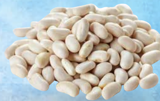
Fižol beli Odlično 5 kg • T.P.: 1 kos • ŠIFRA art.: 070597 • Cena: 14,3500 • Cena z DDV: 15,71