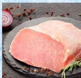
Svinjski laks kare brez kosti T.P.: 1 kg ŠIFRA art.: 725709