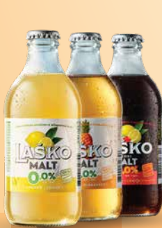
Laško Malt ananas, dark limona šipek, 0,33l T.P.: 20 kos ŠIFRA art.: 117422, 117417