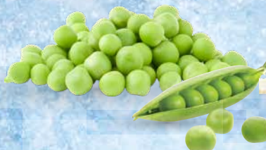
Grah Garden Good 1 kg • T.P.: 10 kos • ŠIFRA art.: 119114 • Cena: 1,6110 • Cena z DDV: 1,76