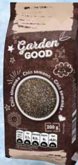
Chia semena Garden Good 200 g • T.P.: 14 Kos • ŠIFRA art.: 849369 • Cena: 1,8063 • Cena z DDV: 1,98