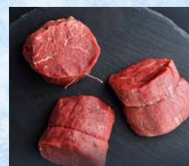
Pljučna pečenka mlada govedina, brez kosti, pakirana, cena za kg T.P.: 1 kg ŠIFRA art.: 343859