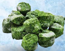
Pasirana špinača Flanders, briketi, 2,5 kg T.P.: X kos • ŠIFRA art.: 161211 Cena: 3,3905 • Cena z DDV: 3,71 Cena za kg: 1,3562