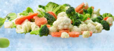
Mešanica zelenjave Flanders 2,5 kg • T.P.: 4 kos • ŠIFRA art.: 684961 • Cena: 3,7535 • Cena z DDV: 4,11 • Cena za kg: 1,5014