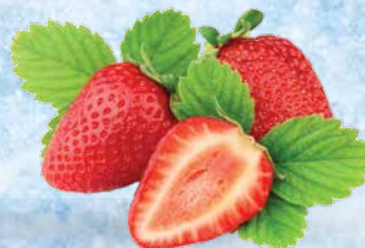
Jagode gojene, 2,5 kg • T.P.: 4 kos • ŠIFRA art.: 373656 • Cena: 6,5000 • Cena z DDV: 7,12 • Cena za kg: 2,6000