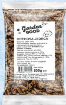
Orehi jedrca Garden Good 500 g • T.P.: 10 kos • ŠIFRA art.: 442700 • Cena: 4,3005 • Cena z DDV: 4,71