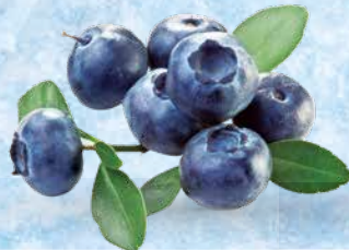
Borovnice Garden Good 400 g • T.P.: 20 kos • ŠIFRA art.: 107529 • Cena: 2,7497 • Cena z DDV: 3,01