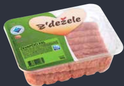
Čevapčiči Z'dežele, 960 g T.P.: 1 kos ŠIFRA art.: 319740