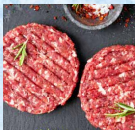
Pleskavica mešana 960 g T.P.: 1 kos ŠIFRA art.: 343911